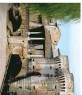
REALISATION SERVICE COMMUNICATION DE LA MAIRIE DE PERNES-LES-FONTAINES.